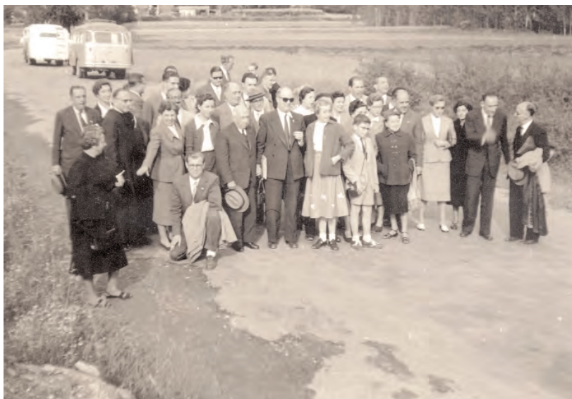
Excursió a Folgueroles