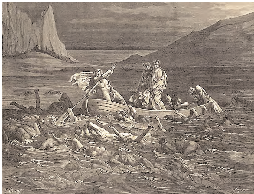
Dant i Virgili als inferns, gravat de Gustav Doré

perquè es constata la presència ja destacable dels estudis clàssics dins de la SCEH i perquè s'endinsa en l'estudi de la tradició clàssica del nostre país. De totes maneres, la constitució de la SCEC encara es féu esperar; fins a 1979 no fou efectiva.